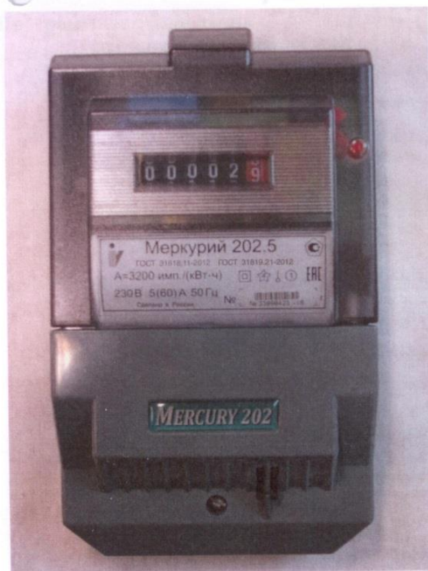
Рисунок 1 - Общий вид счетчика с УО