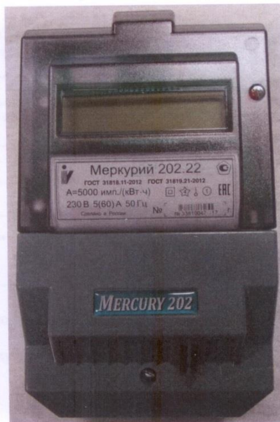
Рисунок 2 - Общий вид счетчика с ЖКИ

Схема пломбировки от несанкционированного доступа, обозначение места нанесения знака поверки представлены на рисунке 3.