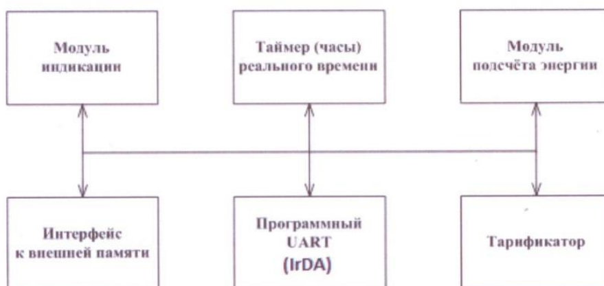
Рисунок 4 - Структура программного обеспечения «Меркурий 202»

В счётчиках с индексом «Т» используется программное обеспечение «Меркурий 202». Структура программного обеспечения «Меркурий 202» приведена на рисунке 4.